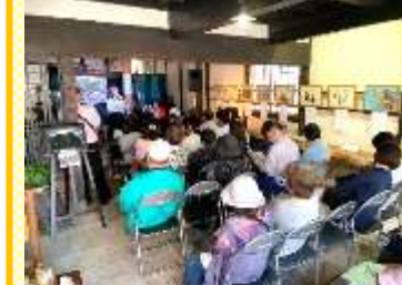
【藩境音楽ストリート】