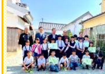
【児童生徒作品展授賞式】

今年も地域の皆様のご理解とご協力を頂き『第20回小保・榎津藩境まつり』を無事開催することができました。本年は、リニューアルオープンした旧吉原家住宅にて開会セレモニーを行い、20回の特別イベントも多数企画し、幅広い年齢層のお客様にご来場いただき、町並みも大変賑わっておりました。