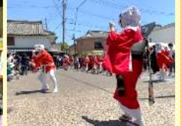
【日向ひょっとこ踊り】